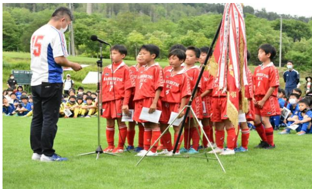
優勝 上江別ジュニア