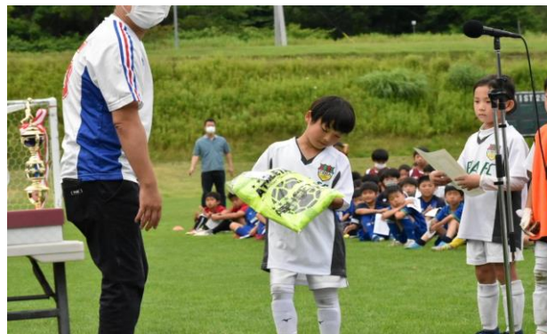
第3位 LIV FOOTBALL CLUB